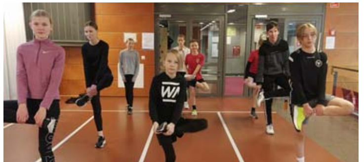
Alkulämmittelyä juoksuosoralla ennen keihäänheittotreeniä.