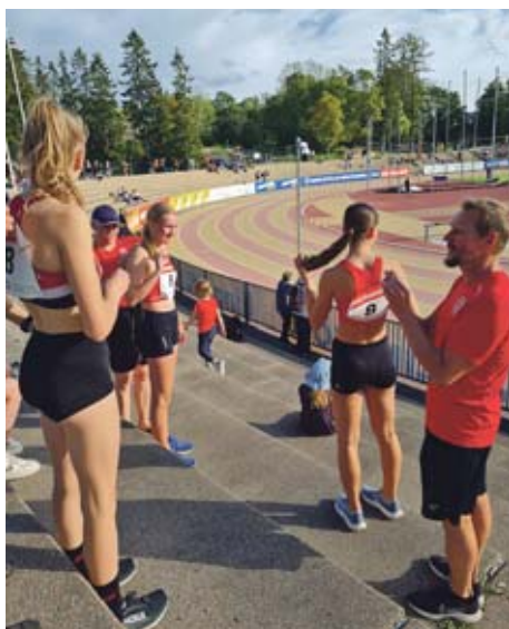
H-hetkeen valmistautumassa SM-viesteissä.