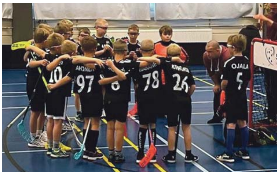
Joukkuehenkeä parhaimmillaan P9.