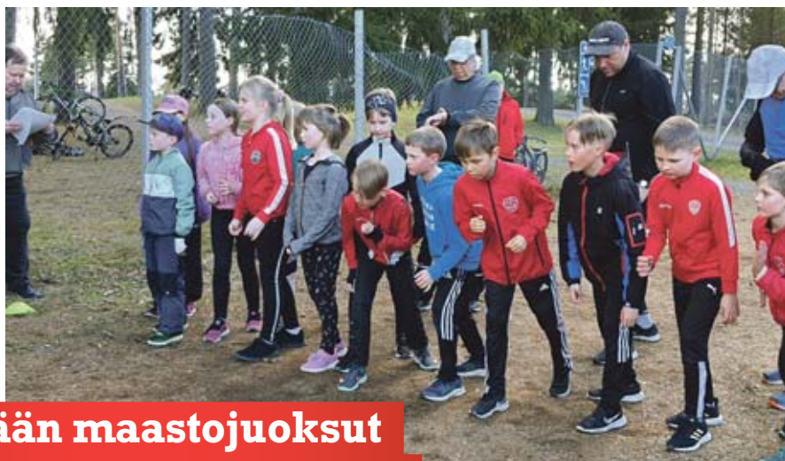
Aika ajoin lähtöviivalla on suurta tungosta.

Kevään maastajuoksut ovat odotettu tapahtuma